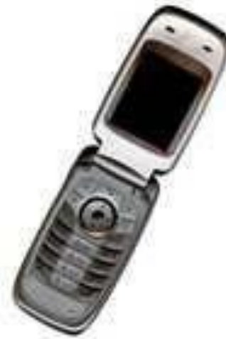
Fig. 2 Ejemplo de figura con baja resolución

Fig. 2 muestra un caso donde la resolución no es adecuada, mientras que Fig. 3 muestra una mejor adaptación de la misma figura.