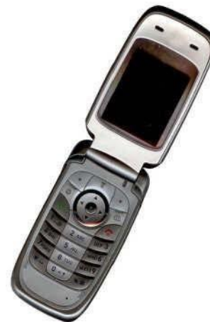
Fig. 3 Ejemplo de figura con buena resolución